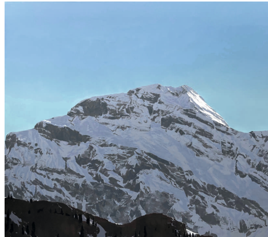
Janko Göttlicher Der Berg 2022

Zu den abendlichen Treffen sind alle, Einheimische wie auch Gäste, eingeladen, im Pfisterhüsli mit den Künstlern von 18.00 bis 19.00 Uhr in Dialog zu treten. Anzutreffen sind sie ausserdem ja auch im Hotel Waldegg, das sie eingeladen hat.