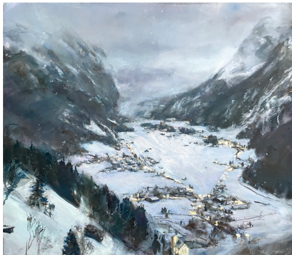
Corinna Weiner Engelberg in der Dämmerung 2022

Pfisterhüsli-Gaddä Titlisstrasse 7 Engelberg